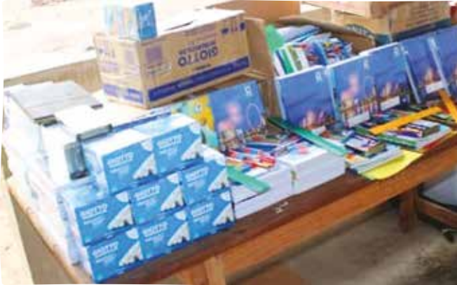
Fournitures scolaires et table-bancs pour Sarayé

Nous continuons notre soutien au Niger malgré l'impact de la crise politique et sécuritaire que connaît le pays actuellement.