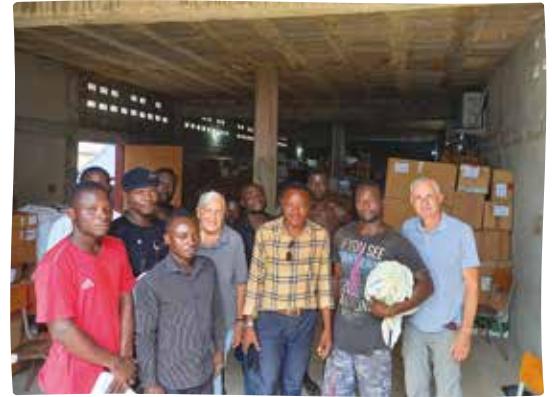
Déchargement à Lomé au Togo

Cette une belle satisfaction de voir que notre activité conteneurs fonctionne au mieux.