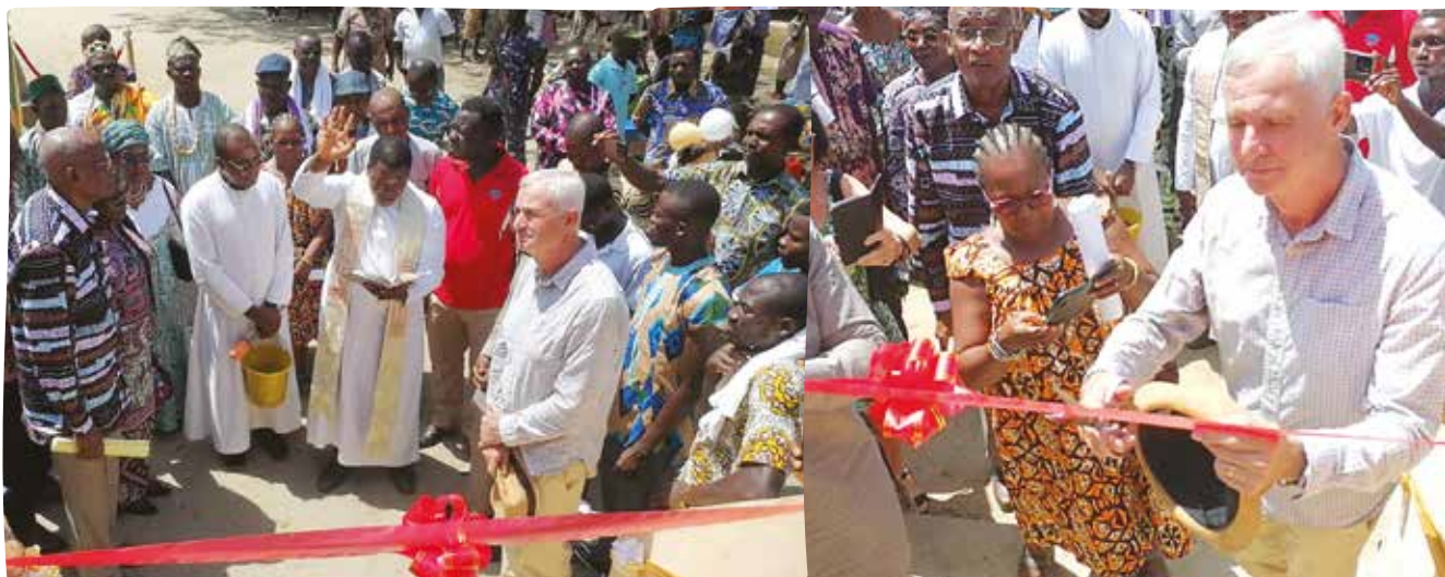
La cérémonie du ruban