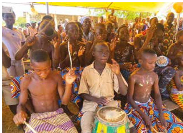
Le chant et les danses

Ce sont celles qui ont le cœur plein d'amour, les oreilles prêtes à écouter et surtout les mains prêtes à aider. Votre vie ne deviendra meilleure qu'en rendant celle des autres meilleure. »