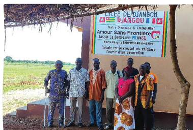
Les enseignants devant leur nouveau bâtiment

Après l'achèvement du bâtiment au mois de mai 2023, nous venons d'achever les blocs toilettes de type ecosan. C'est-à-dire avec séparation des matières fécales et des urines qui seront utilisées comme engrais après stérilisation au soleil. La formation à l'utilisation sera assurée par Richard Mondo.