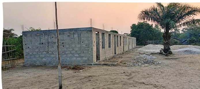
Construction bénéficiant de l'aide de l'Institution Notre Dame des Minimes et du collège Saint Louis-Saint Bruno de Lyon