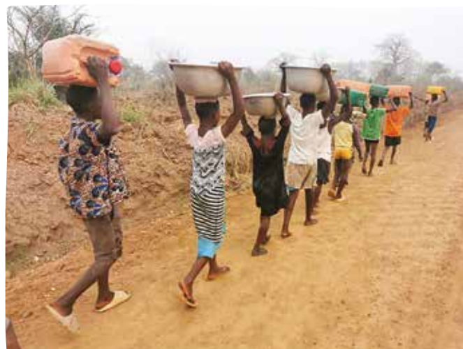
La corvée d'eau

Chaque jour les enfants traversent la route avec des bidons et des bassines sur la tête. Il y a souvent des accidents mortels.