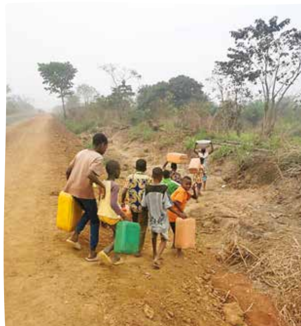
La traversée de la route

De plus, l'eau du marigot est impropre à la consommation et provoque des maladies hydriques graves, parfois mortelles. Je suis passé récemment dans ce village et j'ai pu constater la réalité de la situation. Pour moi il s'agit d'une urgence absolue. Je n'ai pas pu m'empêcher de leur promettre notre aide pour la réalisation de ce forage.