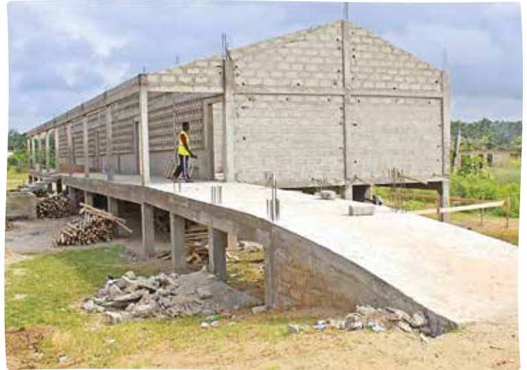
La première école sur pilotis

Le chantier de construction avance vite, ce sera la première école sur pilotis réalisée au Togo. L'école devrait être opérationnelle à la fin du mois de Mars 2023 pour la plus grande joie des enfants et des parents.