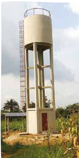
Le château d'eau