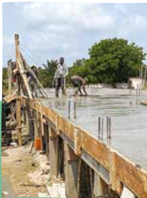
Coulage de la dalle