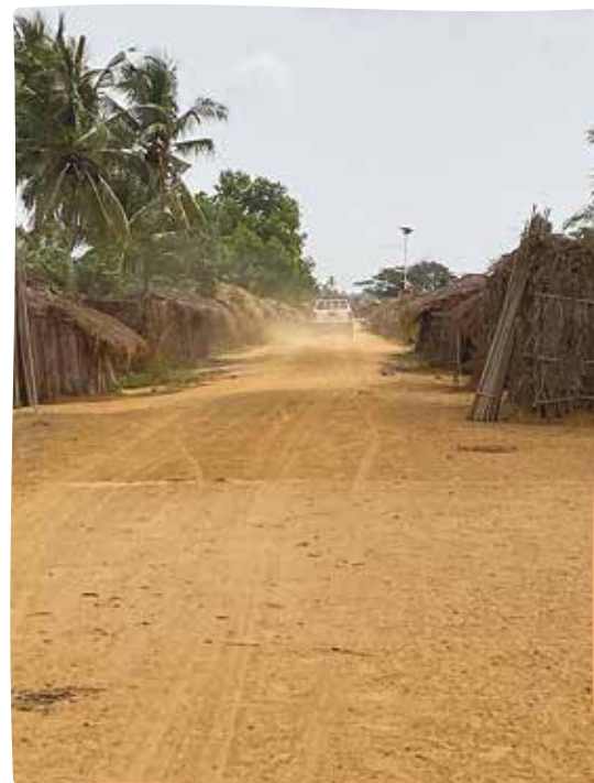
La route sert de refuge