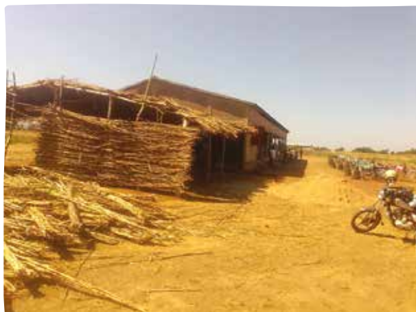
La situation au départ

DJANGOU est un village situé à 10km du chef-lieu de Tône dans le canton de Dapaong dans la région des savanes au nord du Togo.