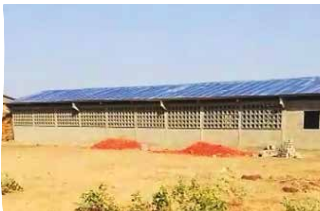
Le bâtiment au 14 mars 2023

Le chantier de construction avance très vite. L'école devrait être opérationnelle à la fin du mois de Mars 2023, comme pour l'école d'Agbanakin. Un vrai soulagement pour le corps enseignant qui pourra ainsi diminuer les effectifs trop nombreux par classe. Un soulagement également aussi pour les parents d'élèves avec enfin une lueur d'espoir pour leurs enfants.