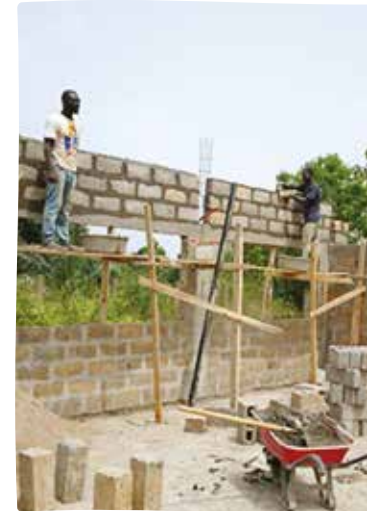
Elévation des murs sous un soleil brûlant