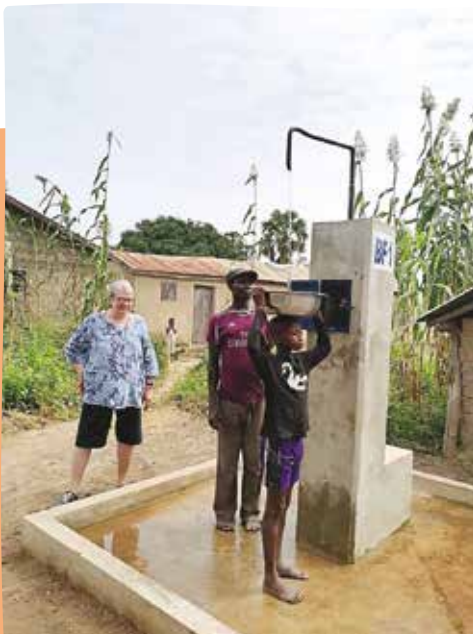
La joie retrouvée

Six forages ont été réalisés, 4 dans le nord du TOGO, 1 dans la région centrale et 1 au NIGER à Kouka permettant à plusieurs milliers de personnes d'avoir accès à de l'eau potable.