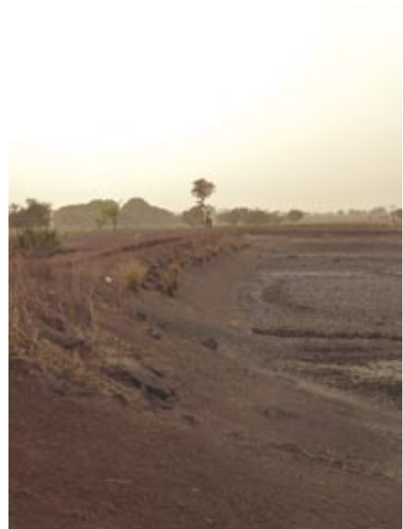
Levée de terre