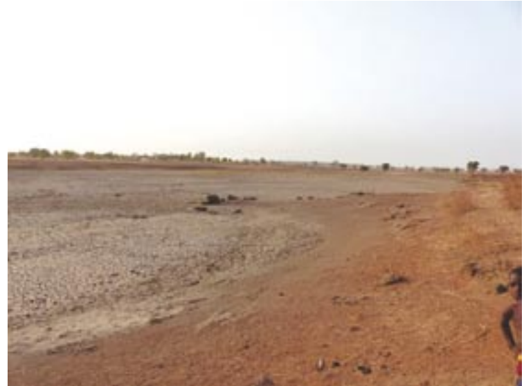
L'effet du réchauffement climatique...