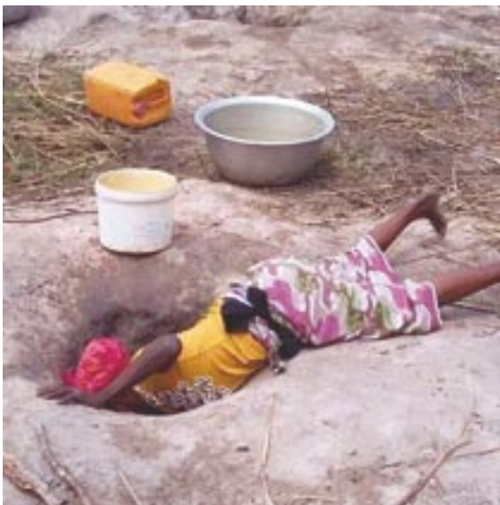
... Jusqu'à la dernière goutte