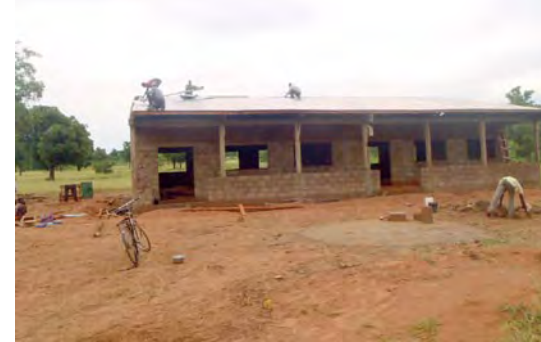
Ecole de Ouyanou.