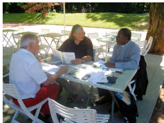
Avec Monseigneur Adjou