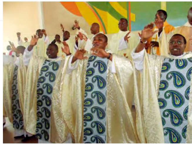
1ère messe à Adamavo pour les 5 nouveaux prêtres S.M.A.

- Entre autre, l'évènement le plus émouvant au cœur de cette année de la foi dans l'Eglise famille de Dieu de Lomé fut l'ordination presbytérale de 18 prêtres missionnaires et religieux dont 5 de la Société des Missions Africaines. C'est dans cette dynamique que nous les avons accueillis tous les 5, avec grande joie, pour leurs prémices le matin du dimanche 11 Août à Adamavo , au lendemain de leur ordination. Cette messe a été concélébrée par une dizaine de prêtres assistés par 4 diacres S.M.A. Après la messe, s'est tenue une collation dans l'enceinte de l'église au cours de laquelle nous avons eu la joie de recevoir les familles des nouveaux ordonnés, les membres de l'amicale S.M.A. et amis venus de la Côte d'Ivoire, du Ghana, du Burkina-Faso, du Nigeria et du Bénin.