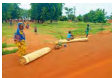
Couverture : Réfugiés du Mali